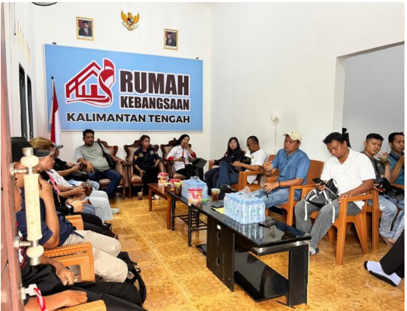
Gambar: Acara Ramah Tamah di Rumah Kebangsaan Kalteng

PALANGKA RAYA - Pelaksanaan pemilihan kepala daerah (Pilkada) yang akan dilaksanakan secara serentak di seluruh wilayah Republik Indonesia, tahun 2024 ini.