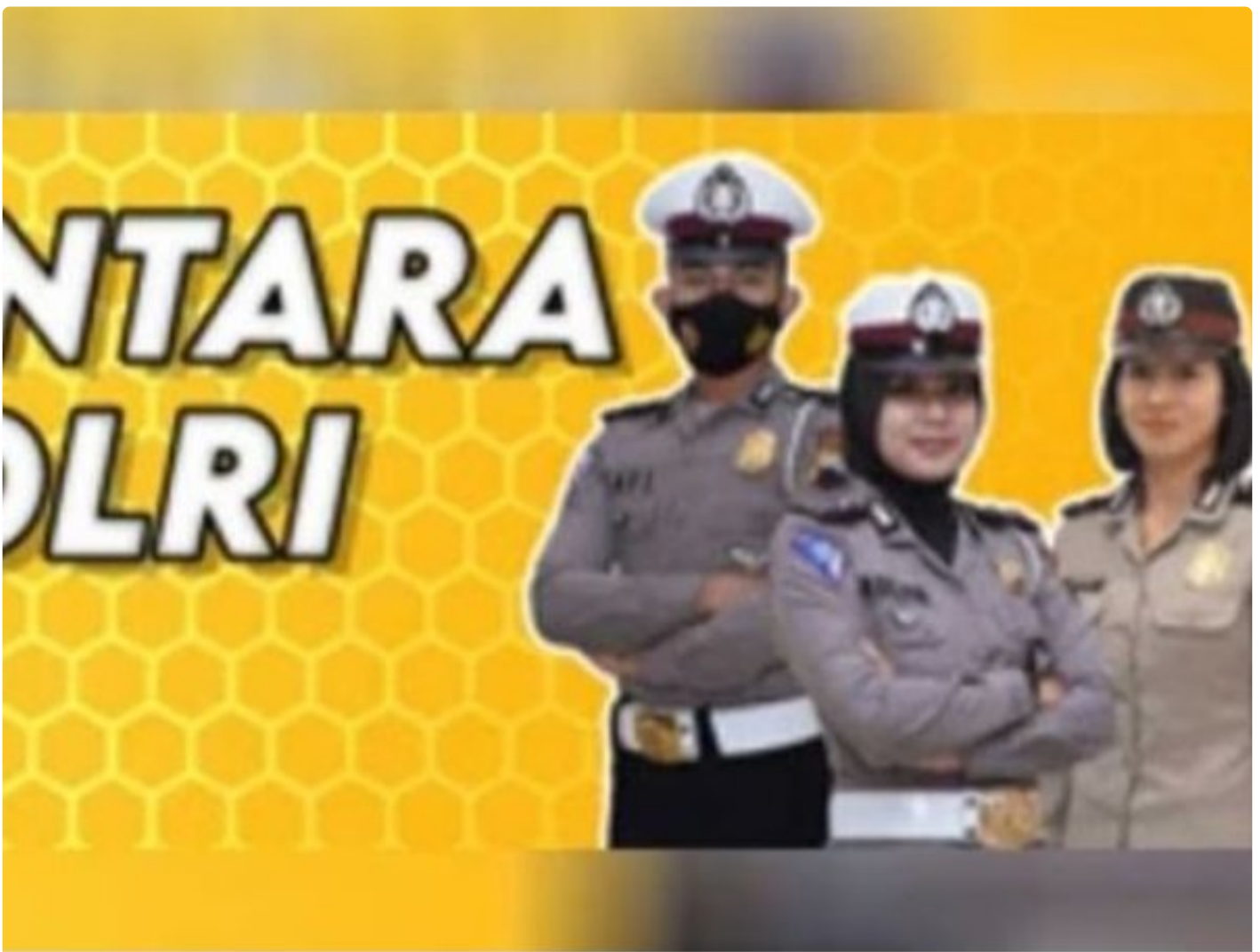
Penerimaan Polri Bakomsus

PALANGKA RAYA - Kesempatan terbuka bagi lulusan bidang pertanian, perikanan, peternakan, gizi, dan kesehatan masyarakat untuk bergabung menjadi anggota Polri melalui program penerimaan Bintara Kompetensi Khusus (Bakomsus).