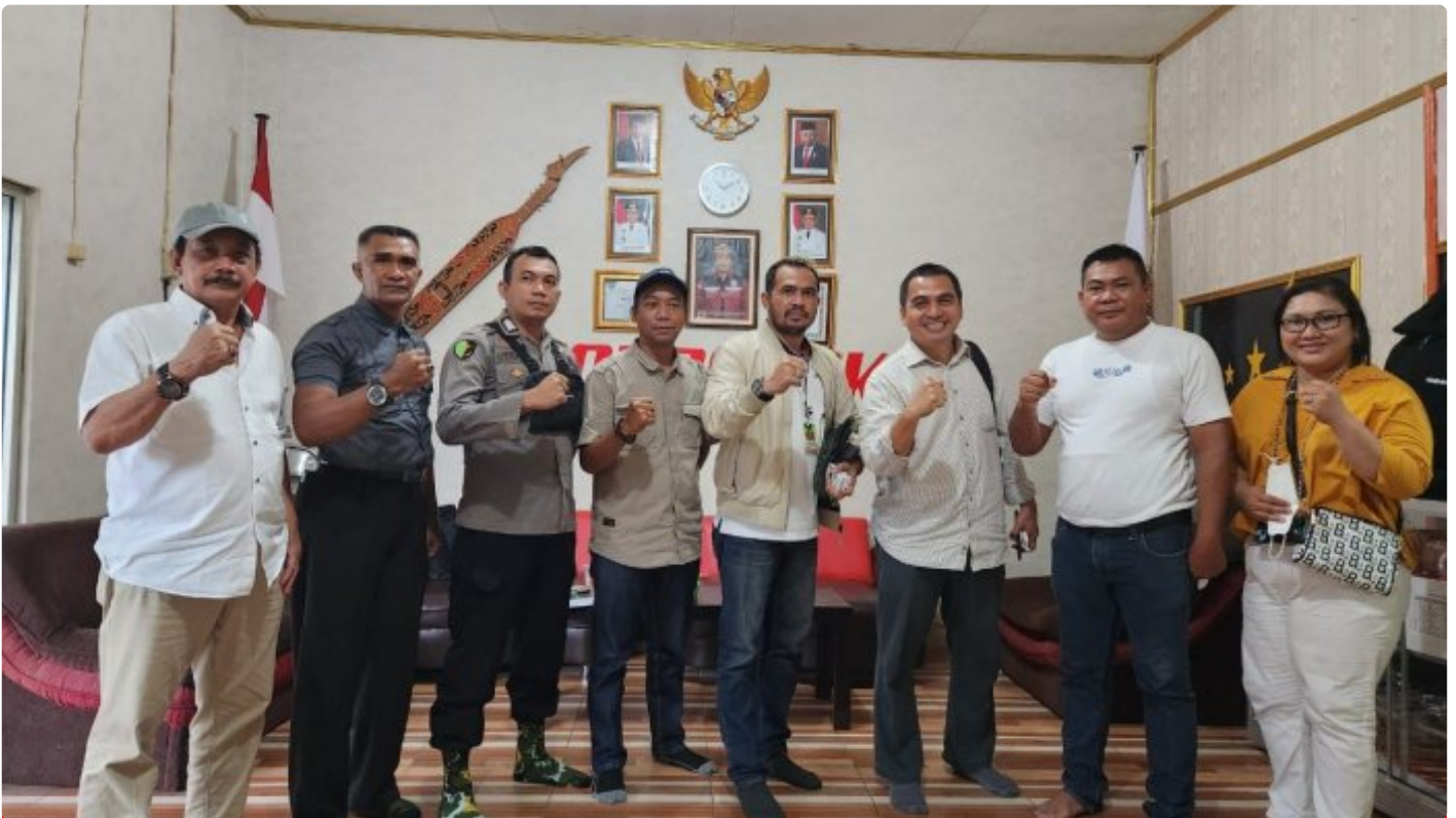
Tim PT Agasa Kalimantan Tengah

PALANGKA RAYA - PT Agasa Kalimantan Tengah (PT Agasa Kalteng) merupakan Badan Usaha Jasa Pengamanan (BUJP) Perusahaan lokal Kalimantan Tengah yang bergerak di bidang industri security, meliputi “Jasa Pelatihan Dasar SATPAM (Gada Pratama/Madya), dan Jasa Tenaga Pengamanan (Outsourcing)”.